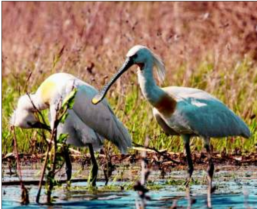
Auch der Löffler gehört zu den bedrohten Arten.

Die beiden Bootsführer fahren deshalb ständig auf Blickkontakt. „Hier im Delta verändert sich die Landschaft relativ schnell“, sagt Tibi. „Kanäle, die gestern noch mit Wasser geflutet waren, können heute fast ausgetrocknet oder durch schwimmende Schilfinselfen verstopft sein.“ Doch genau das verleiht dem Donaudelta seinen besonderen Reiz. Selbst ortskundige Führer und Einheimische entdecken das Delta so immer wieder aufs Neue.